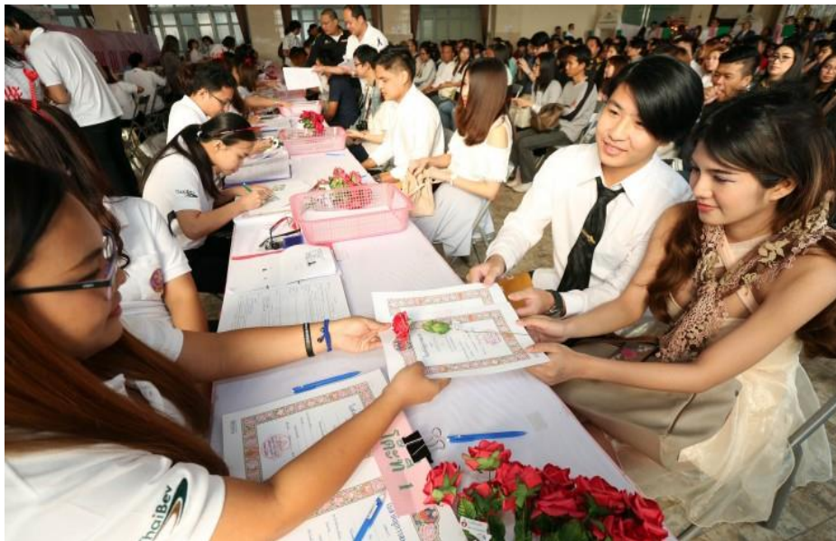
ภาพที่ 6 : การจดทะเบียนสมรส ณ ที่ว่าการอำเภอ หรือ สำนักงานเขต

ระเบียบประเพณีก่อนที่จะอยู่กินกันแบบสามีภรรยาที่ฝ่ายชายต้องส่งผู้ใหญ่ไปสู่ขอหญิงสาว เป็นการประกาศให้สังคมรับรู้ถึงการอยู่กินแบบสามีภรรยา นอกจากพิธีแต่งงานแล้วทั้งคู่จะต้องไปจดทะเบียนสมรสกัน ณ ที่ว่าการอำเภอ สำหรับต่างจังหวัด และ ณ สำนักงานเขตสำหรับกรุงเทพมหานคร เพื่อให้ถูกต้องตามกฎหมาย