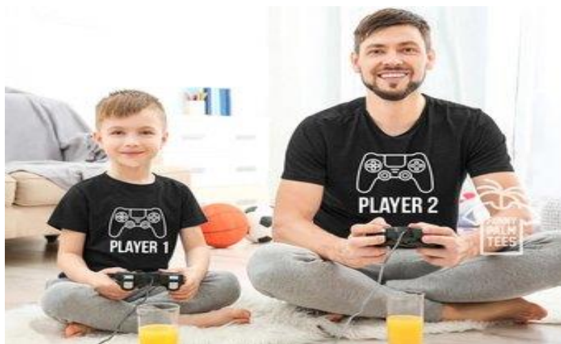
ภาพที่ 2 : วัยรุ่นมักจะเลียนแบบบุคคลที่อยู่ใกล้ชิด

ความสำคัญของความเสมอภาคทางเพศนั้น ขึ้นอยู่กับความเข้าใจในบทบาททางเพศและการมีสัมพันธภาพที่เหมาะสมระหว่างชายหญิง โดยวัยรุ่นจะรู้สึกอ่อนไหวกับคำพูด ที่เกี่ยวข้องกับบทบาททางเพศของตนเองมากขึ้น โดยวัยรุ่นจะเลียนแบบพฤติกรรมซึ่งเป็นบทบาททางเพศจากบุคคลที่ใกล้ชิดกับตัวเอง กล่าวคือ วัยรุ่นชายจะเลียนแบบจากพ่อ พี่ชาย หรือญาติชายที่ใกล้ชิด ในขณะที่วัยรุ่นหญิงก็จะเลียนแบบจากแม่ พี่สาว หรือญาติสาวที่สนิท