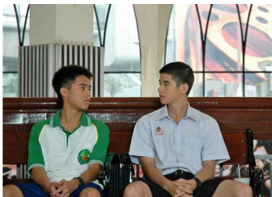
ภาพที่ 10 : กลุ่มชายรักชาย (ภาพยนตร์เรื่อง รักแห่งสยาม)

1) ชายรักชาย หรือเกย์ (Gay) แบ่งเป็น 2 ประเภท ได้แก่ เกย์คิง หมายถึง ผู้ที่แสดงบทบาททางเพศเป็นชายหรือฝ่ายกระทำเมื่อมีเพศสัมพันธ์ ส่วนอีกประเภทหนึ่งคือ เกย์ควีน หมายถึง ผู้ที่แสดงบทบาททางเพศเป็นหญิงหรือฝ่ายถูกกระทำเมื่อมีเพศสัมพันธ์