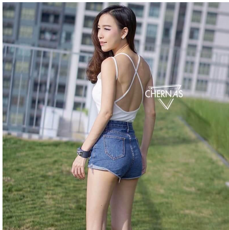
ภาพที่ 4 : สาวสมัยใหม่แต่งกายล่อแหลมเสี่ยงต่อการถูกรังแกทำอนาจาร

ความสนใจเพศตรงข้ามเป็นเรื่องปกติของคนเมื่อเข้าสู่วัยรุ่น การชอบหรือสนใจเพศตรงข้าม ควรปฏิบัติตามประเพณีวัฒนธรรมของสังคมนั้นๆ วัยเรียนควรคบเพื่อนต่างเพศแบบเพื่อน หากคบแบบคู่รักก็ต้องอยู่ในกรอบประเพณีอันดีงาม และให้พ่อแม่หรือผู้ปกครองรับรู้ และต้องเชื่อฟัง ปรึกษาพ่อแม่ ผู้ปกครอง เพราะวัยรุ่นยังไม่บรรลุนิติภาวะ อาจรู้เท่าไม่ถึงการณ์ หรือทำผิดพลาดขึ้นได้