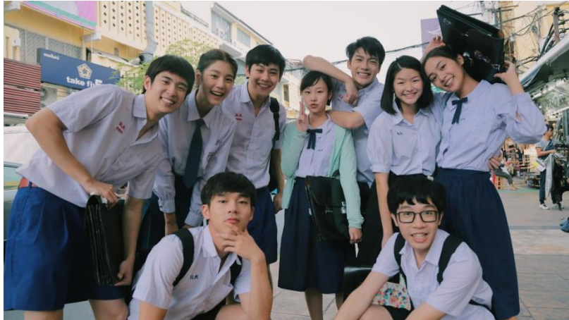
ภาพที่ 8 : การวางตัวต่อเพื่อนเพศตรงข้ามของวัยรุ่น

การวางตัวต่อเพศตรงข้าม หมายถึง การที่ผู้ชายหรือผู้หญิงประพฤติปฏิบัติต่อกัน เพื่อสร้างสัมพันธภาพที่ดีระหว่างกันในแบบเพื่อน แบบพี่น้อง หรือแบบคู่รักภายใต้สภาพแวดล้อม ตลอดจนขนบธรรมเนียมประเพณีและวัฒนธรรมในสังคมนั้นๆ