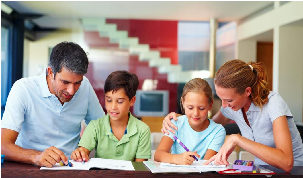
ภาพที่ 12 : พ่อแม่ต้องประพฤติตนเป็นแบบอย่างที่ดีต่อลูก

2.3.4 ส่งเสริมให้มีความรู้ความเข้าใจที่ถูกต้องด้านเพศศึกษา