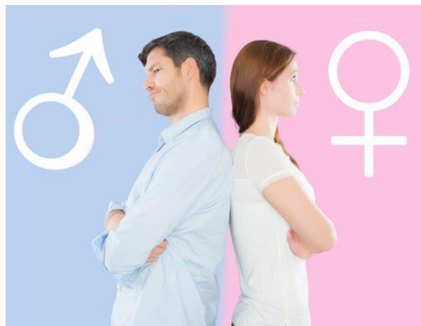
ภาพที่ 1 ความเสมอภาคทางเพศ

สังคมยุคโลกาภิวัตน์ที่ผู้คนดำเนินไปตามแบบวัฒนธรรมตะวันตกมากขึ้น ทำให้บทบาทของชายหญิงได้รับการมองว่าต้องมีความเสมอภาคเท่าเทียมกัน ซึ่งสังคมไทยก็เปิดกว้างยอมรับค่านิยมแบบสากลนี้ ในอดีตจะไม่ค่อยเสมอภาคกันระหว่างชายกับหญิง แต่ก่อนผู้ชายมักจะหาเลี้ยงครอบครัว ผู้หญิงมักจะเป็นแม่บ้านดูแลบ้านเรือนและบุตร ผู้ชายจึงมีอำนาจเหนือกว่าตามสถานภาพ