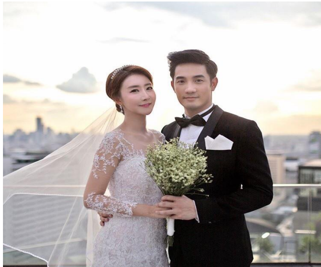
ภาพที่ 5 : การเลือกคู่ครองปัจจุบันเป็นไปด้วยความสมัครใจของทั้งสองฝ่าย

ปัจจุบันมีวัยรุ่นจำนวนมากไม่น้อยที่มีเพศสัมพันธ์ เป็นการขัดต่อวัฒนธรรม ขนบธรรมเนียมอันดีงามของไทย ซึ่งบางรายพ่อแม่หรือผู้ปกครองก็ไม่รู้ แต่บางรายพ่อแม่รู้ ก็ต้องช่วยกันแก้ไขปัญหาต่อไป เป็นการสร้างความหนักใจแก่ผู้ปกครองแล้วยังทำให้เสื่อมเสียต่อวงศ์ตระกูล ถ้าเกิดตั้งครรภ์ขึ้นมาจะต้องเสียอนาคตและเกิดปัญหาสังคมในระยะยาว