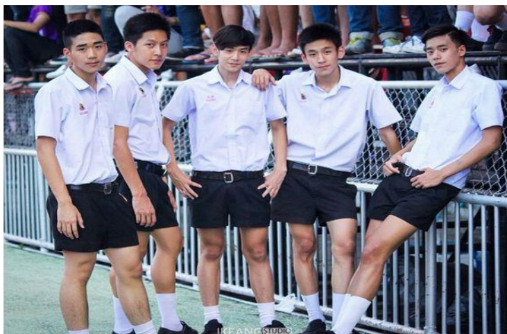
ภาพที่ 7 : การวางตัวต่อเพศเดียวกันในฐานะเพื่อนควรมีความจริงใจซึ่งกันและกัน

การปฏิบัติโดยทั่วไปก็เหมือนๆ กับการวางตัวแบบเพื่อน แต่คนที่จำเป็นต้องเสียสละมากกว่า มีความเอื้อเฟื้อ เอ็นดูต่อน้อง ปกป้องน้อง ช่วยเหลือน้อง ให้คำแนะนำ สั่งสอนน้องตามสมควร ทำตัวเป็นแบบอย่างที่ดีแก่น้อง วางตัวให้เป็นที่เคารพนับถือของน้อง สำหรับคนที่พี่น้องก็ต้องให้ความเคารพนับถือพี่ เชื่อฟังพี่ ช่วยเหลือพี่เมื่อมีโอกาส