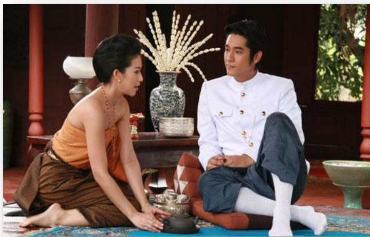
ภาพที่ 3 : สมัยโบราณผู้ชายจะมีสิทธิและศักดิ์ศรีเหนือกว่าผู้หญิง

ยุคประชาธิปไตย ผู้หญิงมีการศึกษามากขึ้น สังคมเปิดโอกาสให้ผู้หญิงทำงานหารายได้เลี้ยงครอบครัวมากขึ้นมีบทบาททางการศึกษามากขึ้น จนเป็นที่ยอมรับกันว่าผู้ชายและผู้หญิงควรมีสิทธิและศักดิ์ศรีเท่าเทียมกัน