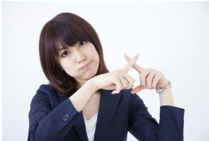
ภาพที่ 6 : การใช้ทักษะการปฏิเสธในกรณีที่ถูกชักชวนให้ทำสิ่งที่ไม่เหมาะสม

4. การต่อรอง การต่อรองเป็นทักษะที่เราใช้ เมื่อเราปฏิเสธการถูกชักชวนแล้ว ยังถูกรบเร้าหรือพูดโน้มน้าว เพื่อให้เราทำตามที่เขาชักชวน เราสามารถต่อรองได้โดยกำหนดกิจกรรมที่มีประโยชน์ไม่เสี่ยงต่อความเสียหาย เช่น เราต้องไปซื้อของให้พ่อแม่ เราต้องทำงาน หรืออาจชวนเขาไปเล่นกีฬา ซึ่งกิจกรรมที่เราต่อรองนี้เป็นสิ่งที่เราต้องทำ ไม่ใช่ว่างอยู่พอที่จะไปไหนกับผู้ที่ชักชวน