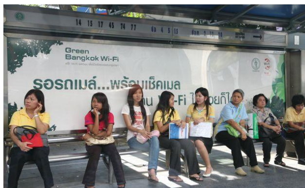
ภาพที่ 4 : การรอรถโดยสารประจำทาง ควรเลือกป้ายรถที่มีคนอยู่เป็นจำนวนมาก

5.8 หากป้ายรถเมล์ไม่มีคนเลย ควรขึ้นรถสายอื่นไปเพื่อเปลี่ยนไปยังป้ายที่มีคนจำนวนมาก สำหรับสุขภาพบุรุษ การไปส่งสุขภาพสตรีกลับบ้านควรแน่ใจว่าเขาเข้าบ้านแล้วจึงออกรถ