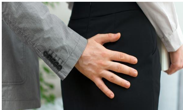
ภาพที่ 1 : การกระทำอนาจาร เป็นการล่วงละเมิดทางเพศที่เป็นการกระทำชัดแจ้ง