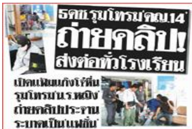
ภาพที่ 5 : ปัญหาการล่วงละเมิดทางเพศมีแนวโน้มสูงขึ้น ที่มา : หนังสือพิมพ์ไทยรัฐ. 2552 : 1