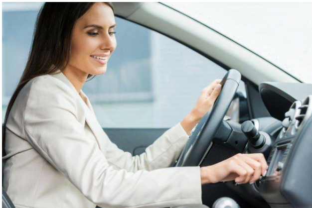
ภาพที่ 3 : ควรปิดประตู และล็อคประตูรถทุกครั้งก่อนสตาร์ทรถ