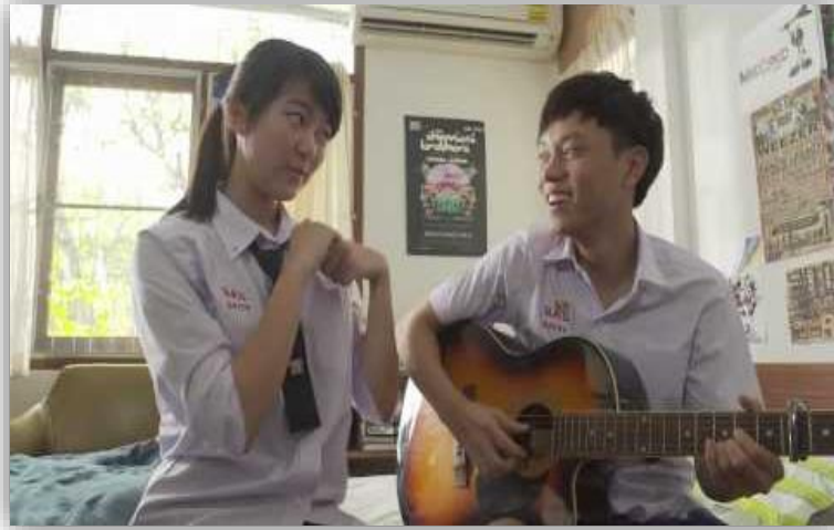
ภาพที่ 8 หลีกเลี่ยงการอยู่กับผู้ชายสองต่อสองในบ้าน

1. อย่าอยู่กับผู้ชายสองต่อสองในบ้าน ห้องเรียน บ้านเพื่อน ในที่ลับหูลับตาคน ไม่ว่าบุคคลนั้นจะเป็นใครก็ตาม