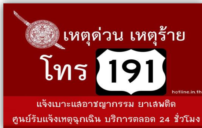
ภาพที่ 9 เหตุด่วนเหตุร้ายโทร 191