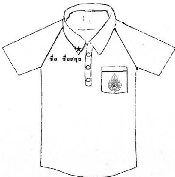
เสื้อพลศึกษา นักเรียนชายและหญิง ชั้นมัธยมศึกษาปีที่ ๔