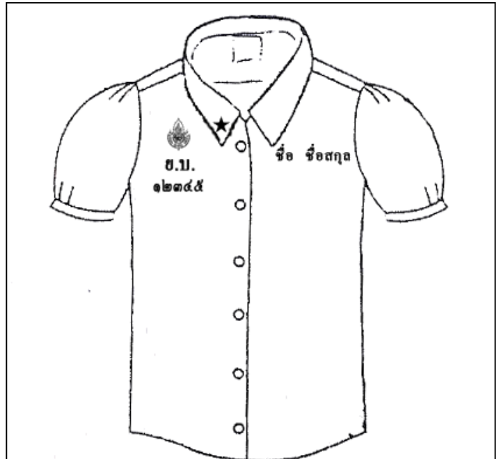
เสื้อนักเรียนหญิงชั้นมัธยมศึกษาปีที่ ๔