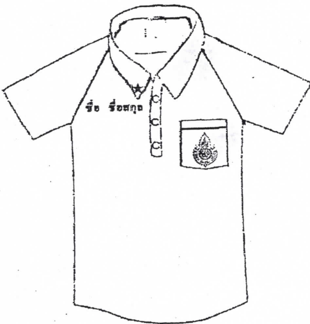
เสื้อพลศึกษานักเรียนชายและหญิง