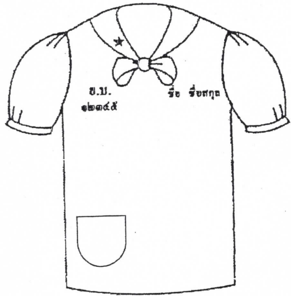
เสื้อนักเรียนหญิงชั้นมัธยมศึกษาปีที่ ๑