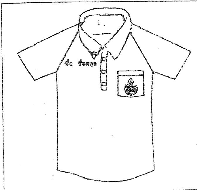
เสื้อพลศึกษานักเรียนชายและหญิง